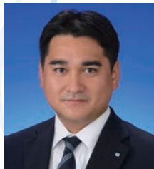
2012年度 愛知ブロック協議会 会長